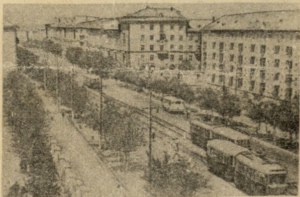
Проспект им. В. И. Ленина в г. Орске.

«И меня в семье великой, семье вольной, новой, не забудьте, помяните добрым, тихим словом».